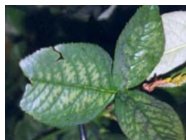
Voorbeeld van bladverbranding bij roos

Afschrijven: indien meer dan 50% van het totale bladoppervlak en/of 50% van het totale aantal bladeren bovenstaand verschijnsel vertoont.