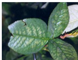
Voorbeeld van bladverbranding bij roos

Afschrijven: indien meer dan 50% van het totale bladoppervlak en/of 50% van het totale aantal bladeren bovenstaand verschijnsel vertoont.