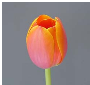
2 half open